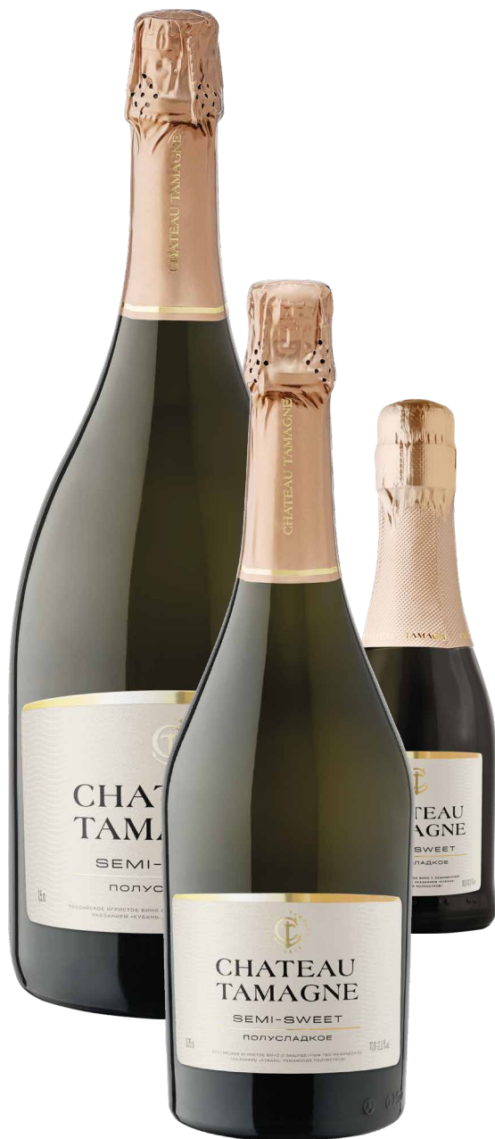
БУТЫЛКИ ОБЪЕМОМ 1,5 Л, 0,75 Л, 0,2 Л

Российское игристое вино с защищенным географическим указанием «Кубань. Таманский полуостров» полусладкое белое «Шато Тамань»